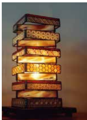
by Takashi Murakami