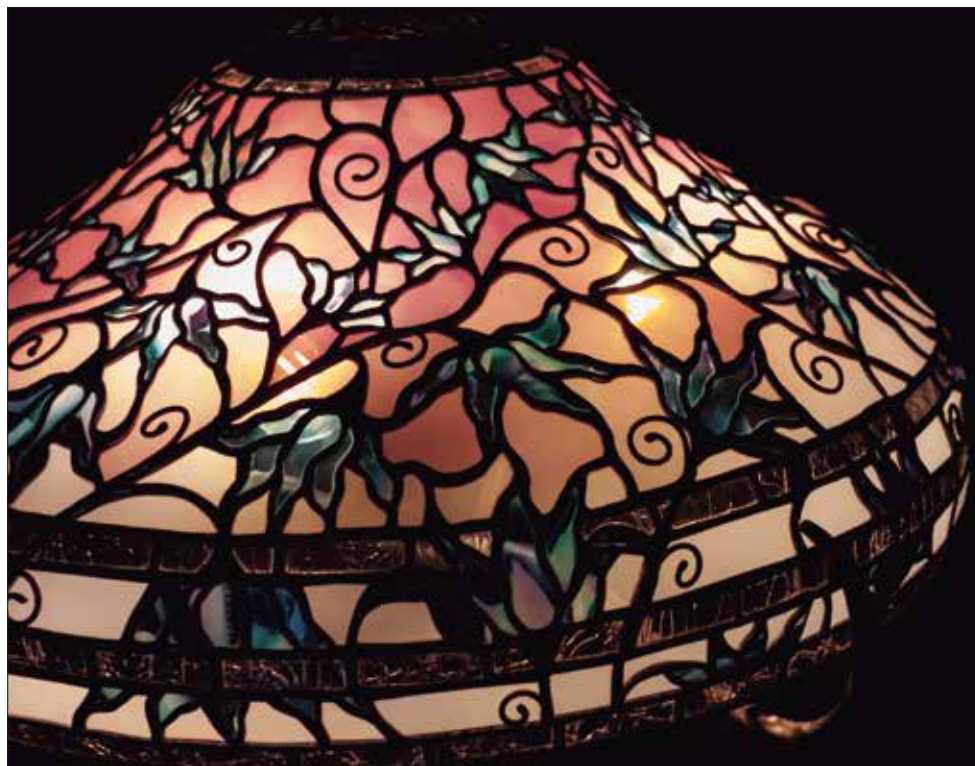
by Kayoko Murakami