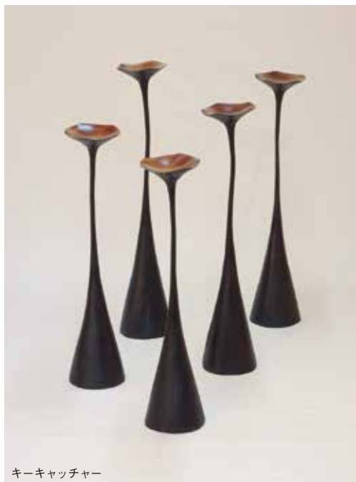
キーキャッチャー