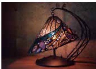
by Kayoko Murakami