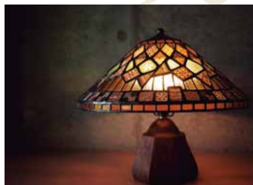
by Kayoko Murakami