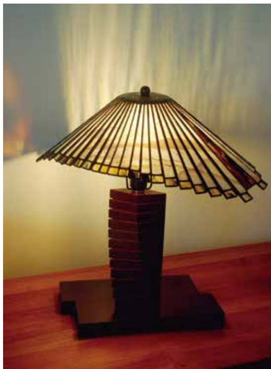
by Takashi Murakami