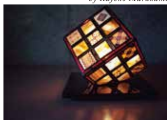
by Kayoko Murakami